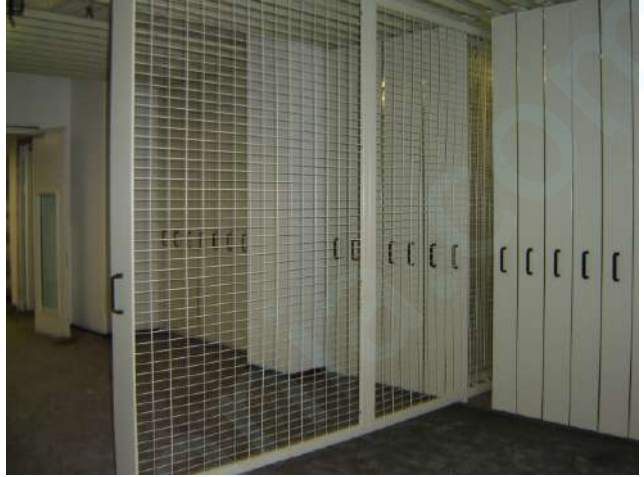
Modelo con panel cierre. Sistema de almacenamiento en mamparas dobles

Tratamiento antioxidante y pintura en poliéster - polvo al horno.