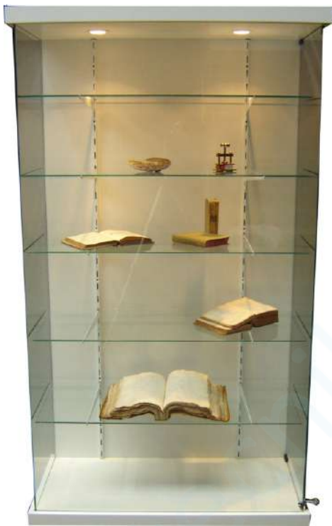
V. E. E