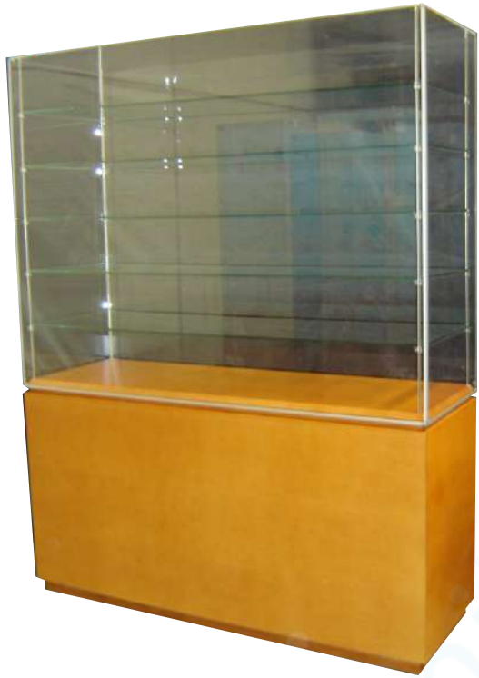
Vitrina con estantes de vidrio y peana de madera barnizada.

Cierre Hermético. Seguridad contra vandalismo. Filtro UV. Desmontable.