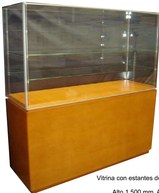
Vitrina con estantes de vidrio y peana de madera barnizada.

Alto 1.500 mm. Ancho 1000 mm. Fondo 500 mm.