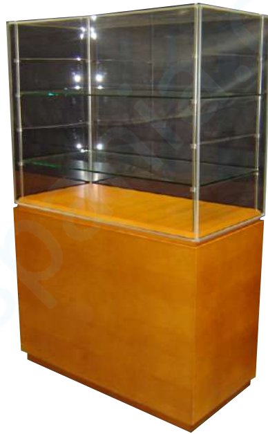
Vitrina con estantes de vidrio y peana de madera barnizada.

Alto 1.850 mm. Ancho 1500 mm. Fondo 500 mm.